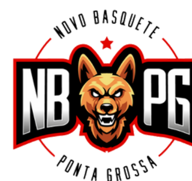
NBPG Ponta Grossa (Ponta Grossa - PR)