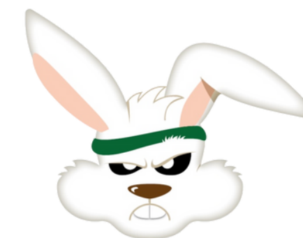
Nosso Clube (Recife - PE)