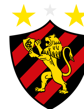
Sport Club do Recife (Recife - PE)