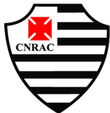
Álvares Cabral (Vitória - ES)