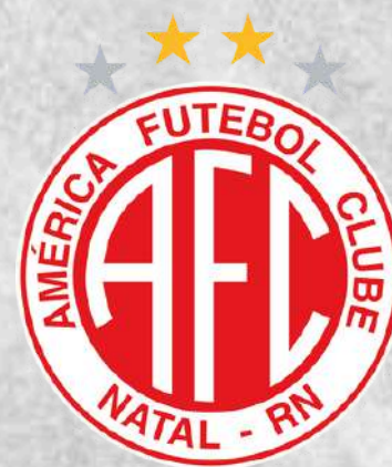
América FC (Natal - RN)