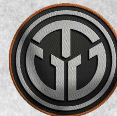
CTC Team (Aracaju - SE)