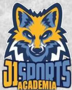
Academia J1 (Jandira - SP)