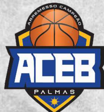
ACEB (Palmas - TO)