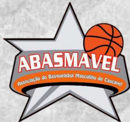
ABASMAVEL (Cascavel - PR)