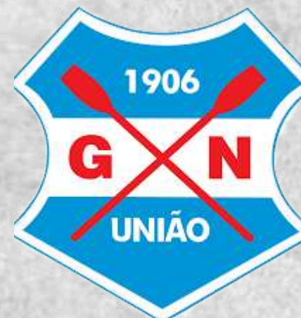
GN União (Porto Alegre - RS)