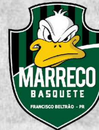
Marreco Basquete (Francisco Beltrão - PR)