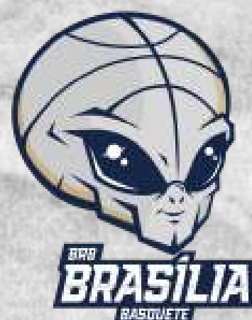
AACB Brasília (Brasília - DF)