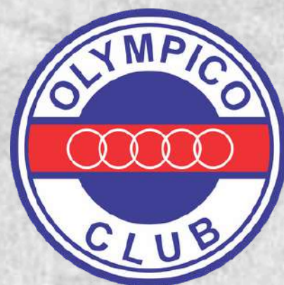
Olympico Club (Belo Horizonte - MG)