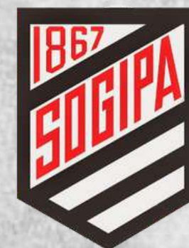
SOGIPA (Porto Alegre - RS)