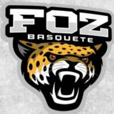
Foz Basquete (Foz do Iguaçu - PR)