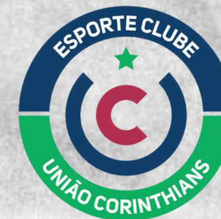
UNICO (Santa Cruz do Sul - RS)