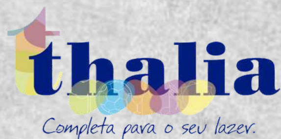
Sociedade Thalia (Curitiba - PR)