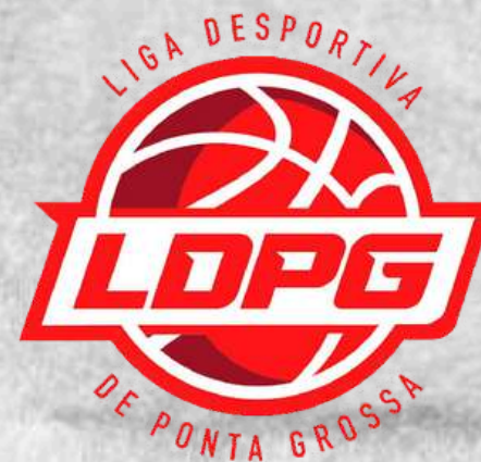
LDPG (Ponta Grossa - PR)