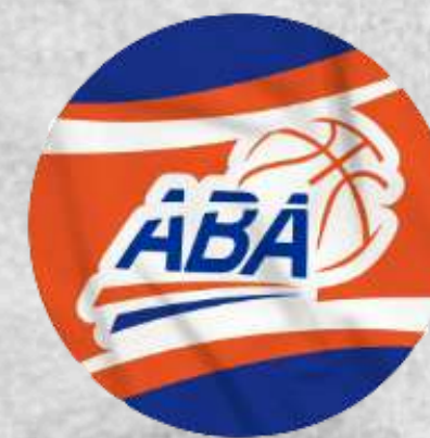
ABA Anápolis (Anápolis - GO)