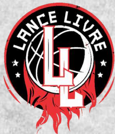
Lance Livre (Brasília - DF)