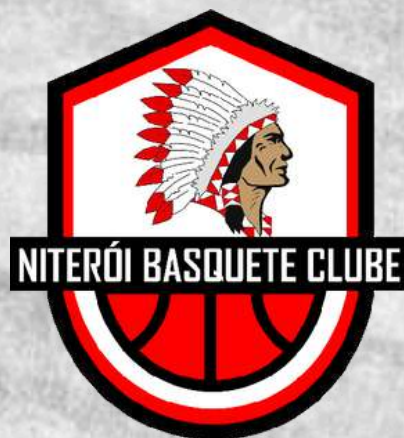
Niterói BC (Niterói - RJ)