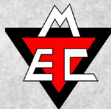
Mackenzie (Belo Horizonte - MG)